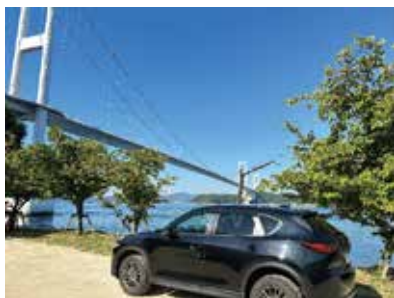
「あなたと車どんな物語がありますか。」