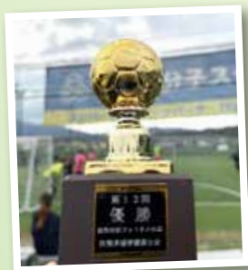
第12回 施設対抗フットサル大会 順位表