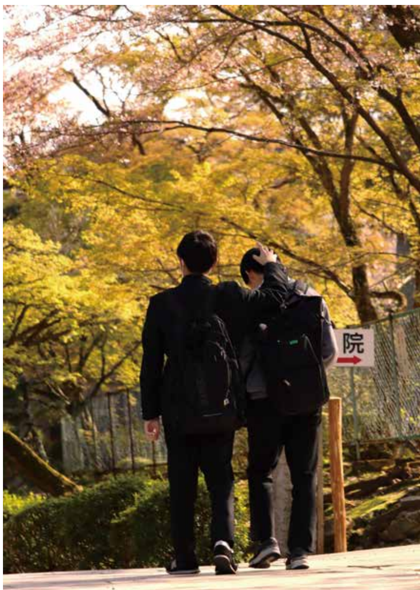
『きっと次は大丈夫さ』