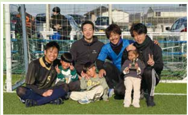
優勝 済生会滋賀県病院