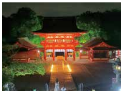
「和の輝きの近江神宮」