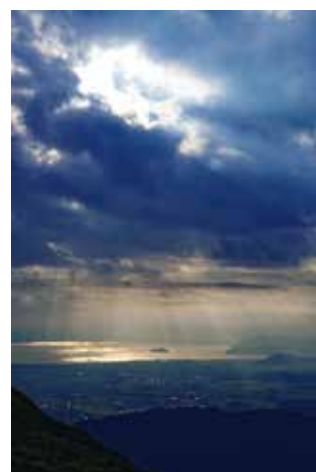
「あわいに掛かるいぶき」