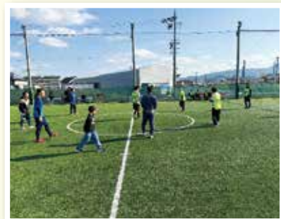
交流イベント ウォーキングフットボール