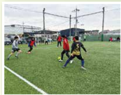
リーグ戦 対戦風景