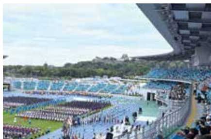
「びわこブルーに染まる」