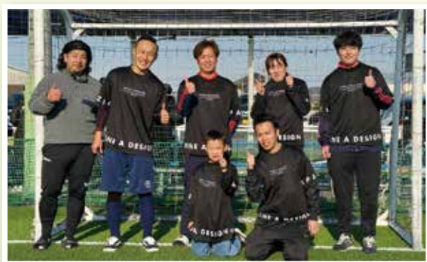
グッドチーム賞 甲西リハビリ病院